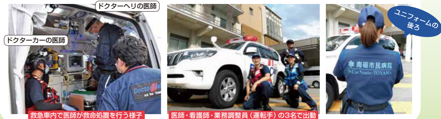
救急車で医師が救命処置を行う様子 医師・看護師・業務調整員（運転手）の3名で出動 ユニフォームの後ろ

出 動 態 勢 出動時間：平日（年末年始・祝日除く）8時45分～17時 出動範囲：南砺市・砺波市庄川町 ※市民からの直接の出動要請は受け付けておりません。 （ただし、多重事故・災害発生時や出動が有効と判断された場合は、砺波医療圏を含む県西部や近隣市町村にも出動する）