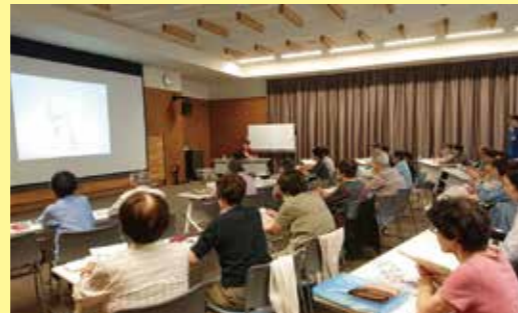
昨年度の教室風景